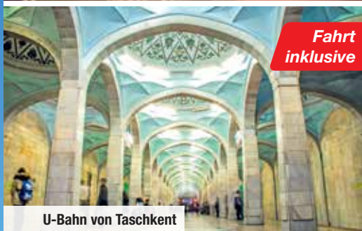
U-Bahn von Taschkent