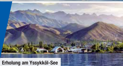
Erholung am Yssykköl-See

Erlebnis-Genusspaket mit landestypischen Spezialitäten Komplettes Erlebnisprogramm mit 5 UNESCO-Welterbestätten