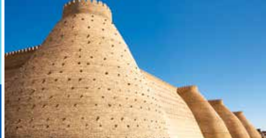
Der Ark – Regierungssitz der Emire