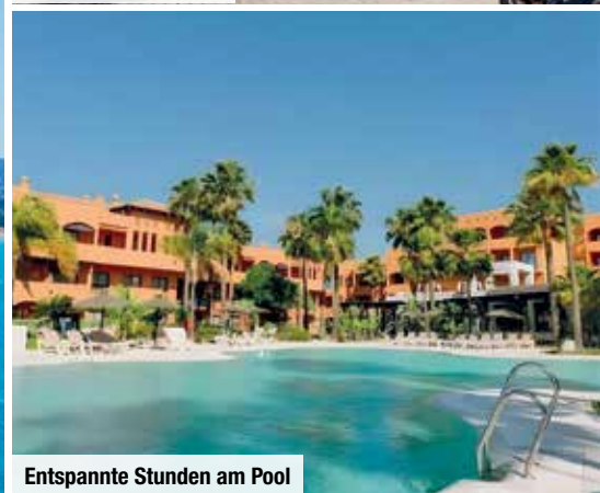
Entspannte Stunden am Pool