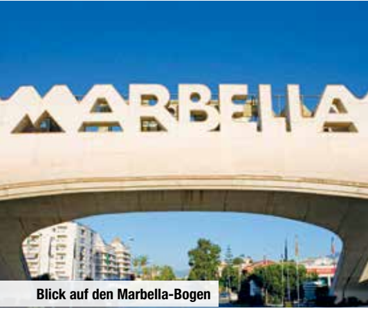
Blick auf den Marbella-Bogen

Freuen Sie sich auch auf ausreichend freie Zeit, in der Sie Marbella auf eigene Faust erkunden können.