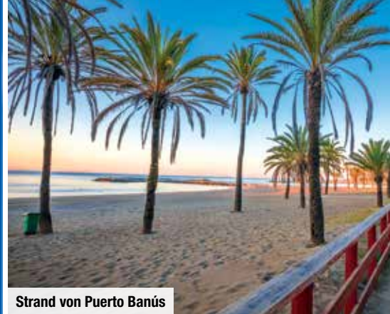
Strand von Puerto Banús

Entdecken Sie auf vor Ort zubuchbaren Ganztagesausflügen weitere andalusische Städteschönheiten wie Málaga, Cordoba und Ronda sowie das zu Großbritannien gehörende Gibraltar!