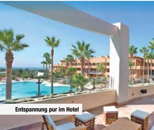
Entspannung pur im Hotel