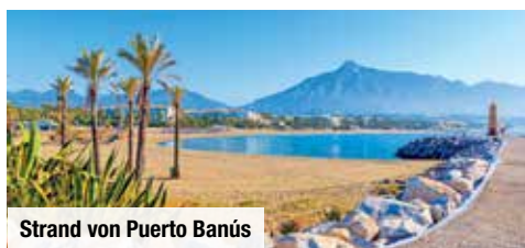
Strand von Puerto Banús