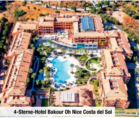
4-Sterne-Hotel Bakour Oh Nice Costa del Sol