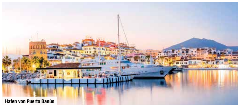
Hafen von Puerto Banús