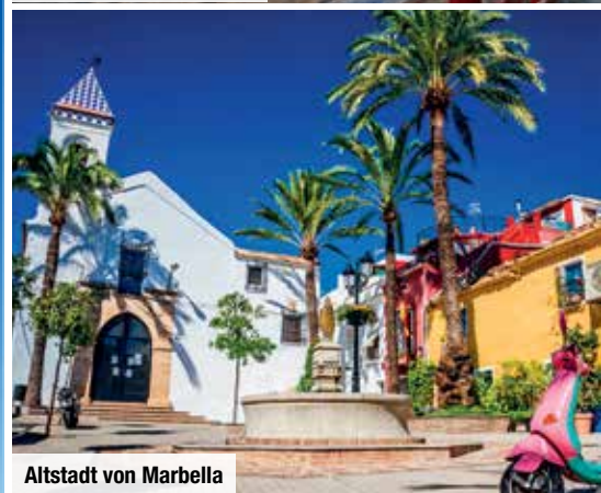
Altstadt von Marbella