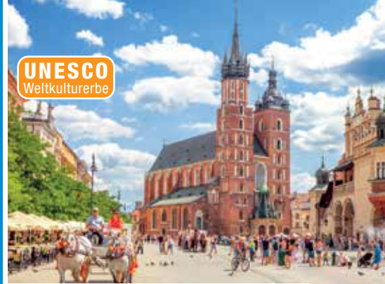
Historisches Zentrum Krakaus mit Marienkirche

Erleben Sie das historische Krakau bei einer zubuchbaren Bootsfahrt auf der Weichsel vom Wasser aus