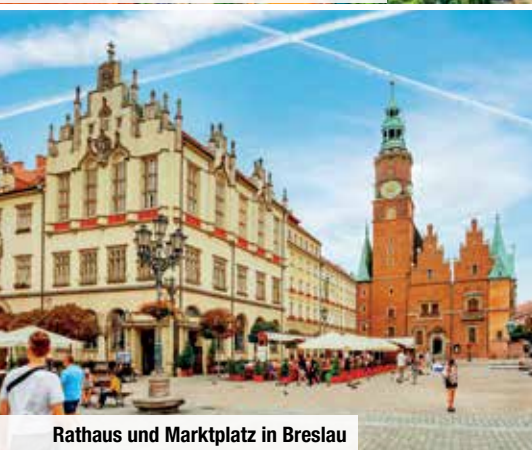
Rathaus und Marktplatz in Breslau