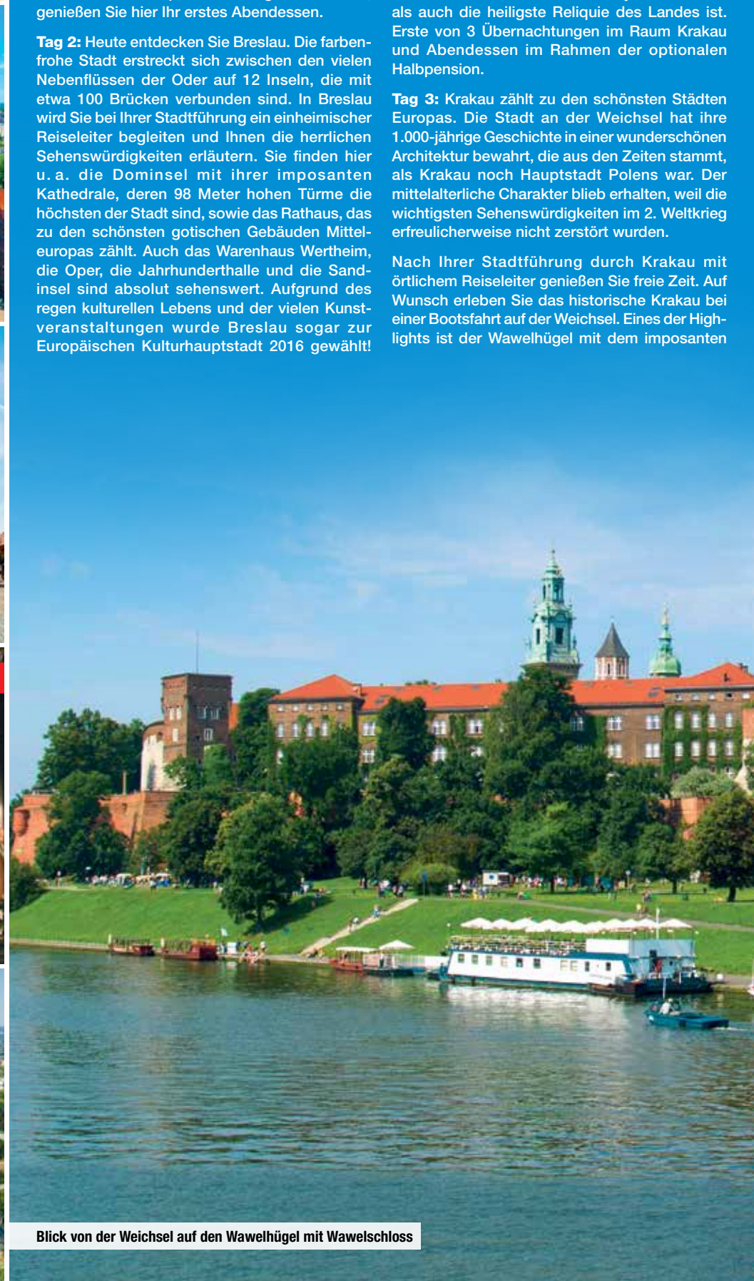
Blick von der Weichsel auf den Wawelhügel mit Wawelschloss