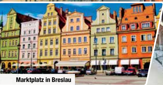
Marktplatz in Breslau

Besichtigung von Kattowitz, Gleitwitz und Oppeln sowie des Klosters Jasna Góra in Tschenstochau