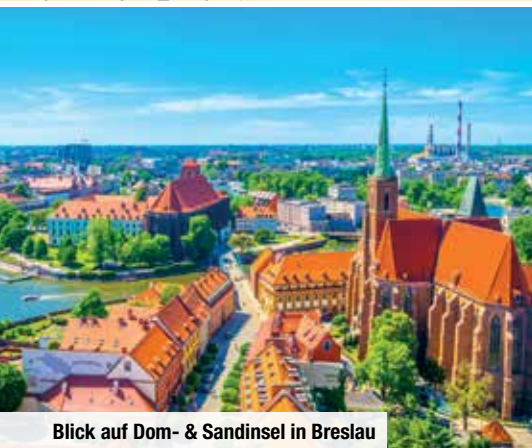
Blick auf Dom- & Sandinsel in Breslau

Nach Ihrer Stadtführung durch Krakau mit örtlichem Reiseleiter genießen Sie freie Zeit. Auf Wunsch erleben Sie das historische Krakau bei einer Bootsfahrt auf der Weichsel. Eines der Highlights ist der Wawelhügel mit dem imposanten