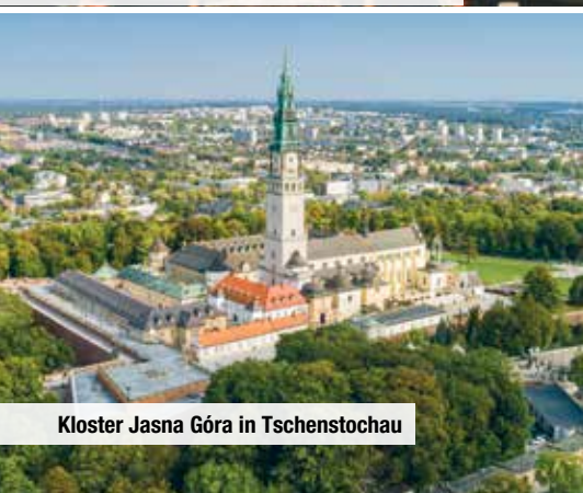
Kloster Jasna Góra in Tschenstochau