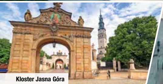
Kloster Jasna Góra